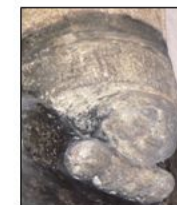
Cul de lampe