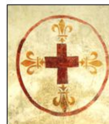
Croix de consécration