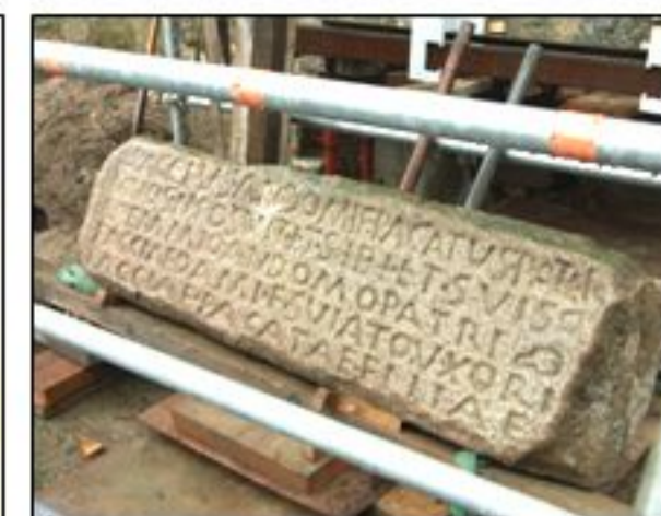
Linteau épitaphe gallo-romain