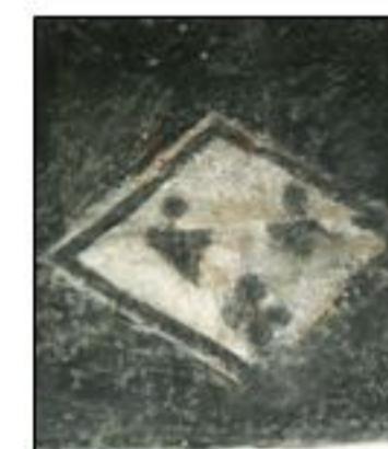
Blason sur litre funéraire.