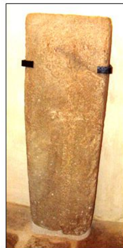
« La Herse à l'épée » : couvercle de sarcophage.