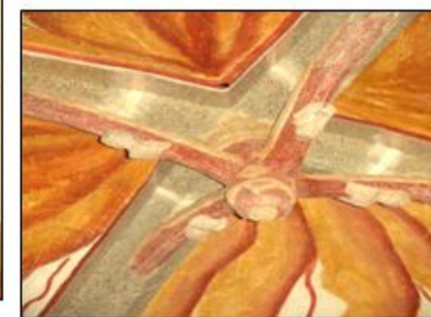
Clef de voûte sur croisées d'ogives